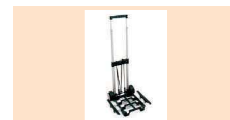
005404 CARRO ALUMINIO ALUMINIUM CART CARRO ALUMÍNIO