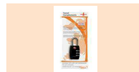
004360 CANDADO COMBINACIÓN TSA (HOMOLOGADO USA) PADLOCK COMBINATION TSA CADEADO COMBINAÇÃO TSA