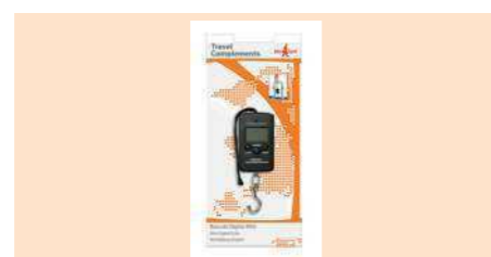
004070 BÁSCULA DIGITAL MINI MINI DIGITAL SCALE MINI BALANÇA DIGITAL