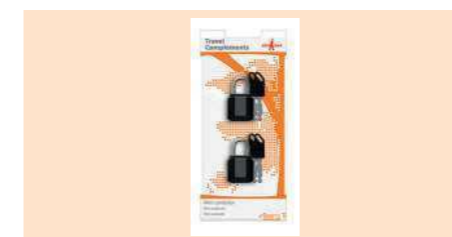
004320 ALMOHADA CANDADO SEGURIDAD 2 U MINI PADLOCKS MINI CADEADO