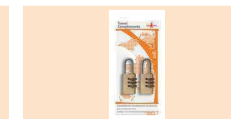
004380 CANDADO COMBINACIÓN 2 U COMBINATION LOCKS 2 UNI. CADEADO, COM COMBINAÇÃO DE SEGREDO 2 U