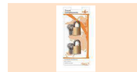
004330 CANDADO BRONCE 2 U BASES PADLOCKS 2 UNI. CADEADO EM LATÃO 2 UNI.