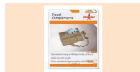
004140 CARTERA CINTURÓN SEGURIDAD WAIST SECURITY POUCH PORTA MOEDAS DE SEGURANÇA PARA USAR Á CINTURA