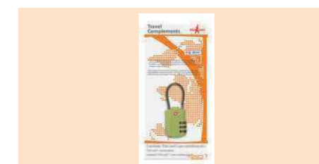
004370 CANDADO COMBINACIÓN TSA CABLE (HOMOLOGADO USA) PADLOCK COMBINATION TSA CADEADO COMBINAÇÃO TSA