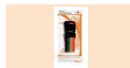
004420 CINTA COMBINACIÓN EQUIPAJE LUGGAGE STRAP WITH COMBINATION LOCK CORREIA BAGAGEM COM FECHO DE SEGREDO