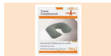
004020 ALMOHADA INFLABLE INFLATABLE NECK REST ALMOFADA INSUFLÁVEL PARA O PESCOÇO