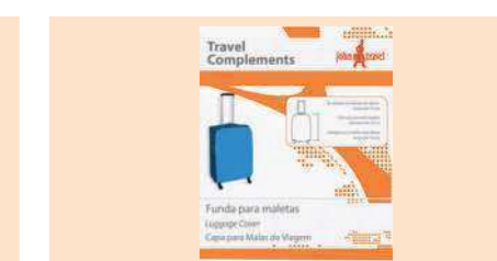
004490 FUNDA PARA MALETAS LUGGAGE COVER CAPA PARA MALETAS DE VIAGEM