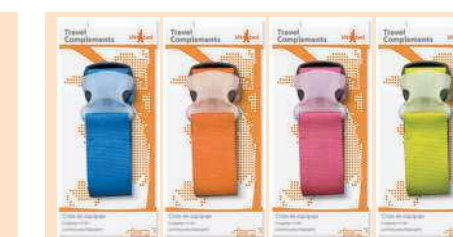
004410 CINTA EQUIPAJE LUGGAGE STRAP CORREIA PARA BAGAGEM