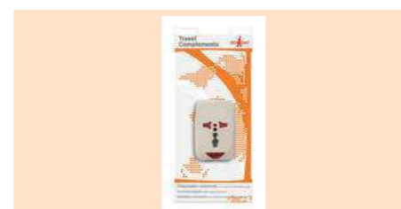
004260 ENCHUFE MULTIUSOS CON PROTECCIÓN UNIVERSAL ADAPTER WITH SURGE PROTECTION TOMADA MULTIUSOS COM PROTECÇÃO