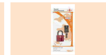
004350 CANDADO TSA (HOMOLOGADO USA) PADLOCK TSA CADEADO TSA