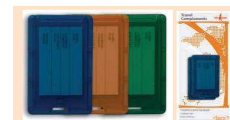
004400 TARJETERO EQUIPAJE 2 U LUGGAGE TAGS 2 UNI. PORTA ENDEREÇO 2 UNI.