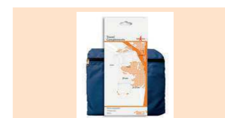
004480 BOLSA PLEGABLE FOLDABLE BAG BOLSA DESDOBRÁVEL