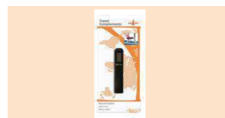
004090 BÁSCULA DIGITAL ASA DIGITAL SCALE BALANÇA DIGITAL DE ASA