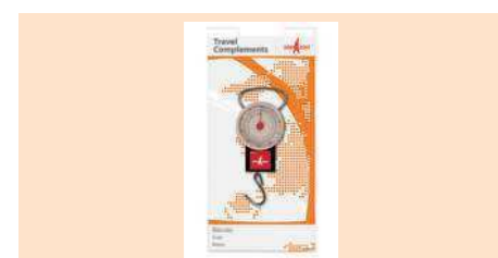
004060 BÁSCULA SCALE BALANÇA