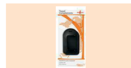
004390 TARJETERO EQUIPAJE PVC 2 U LUGGAGE TAGS PVC 2 UNI. PORTA ENDEREÇO PVC 2 UNI.