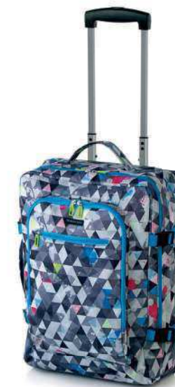
Crew M 1111