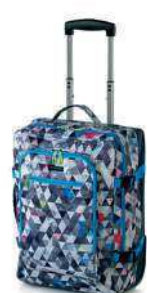
08 PRINT GRIS GREY PRINT / CIENZENTO