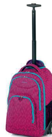
Crew S 1138