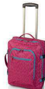
09 PRINT FUCSIA FUCHSIA PRINT / FÚCSIA