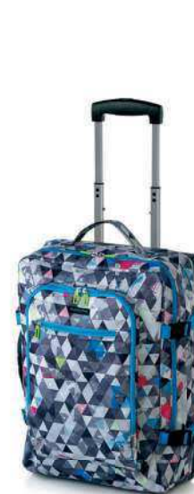
Crew S 1110