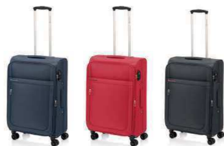
00 AZUL BLUE / AZUL

Figura chave do vanguardismo internacional, Piet Mondrian (1872-1944) foi um pintor extraordinário. As cores básicas de Mondrian são eleitas para esta coleção de viagem fabricada em nylon com um design de quadros estampado fino, sóbrio e elegante. Com os sistema e material de confecção eleito e os componentes, consegue-se um peso ultraleve, com durabilidade e funcionalidade. As suas características convertem-na numa malas eficiente e de alta qualidade, sendo a companheira perfeita para as suas viagens.